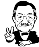
時事評論家 増田俊男